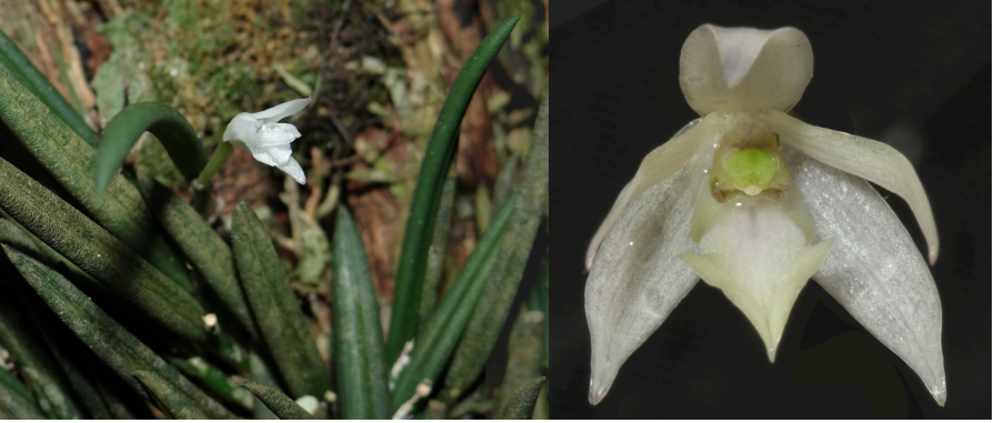
Fig. 2 : Leptotes beatrix

Habitat : épiphyte en forêt très humide. Petite population d'individus éparés.